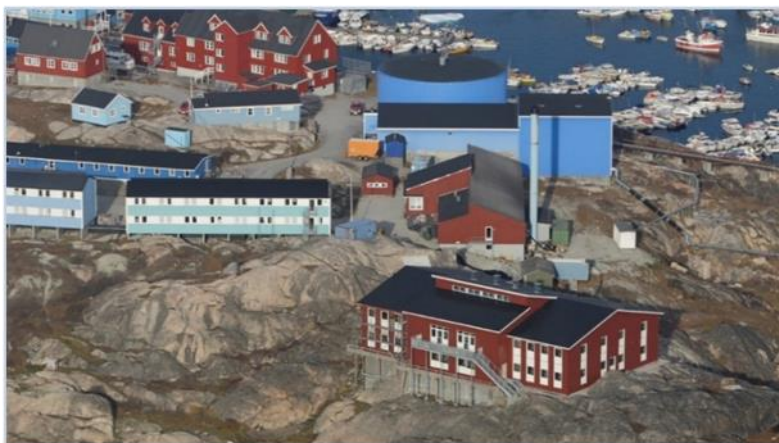
PI/SPS – allilerneqanngikkallarmat

Suliffimmi misiliinermi suliassaq akuerineqanngippat, suliffimmi misiliisoq suliassap pitsanngoriartinnissaa siunertaralugu nutaamik aqutissiorneqarnissamut periarfissaqarpoq.