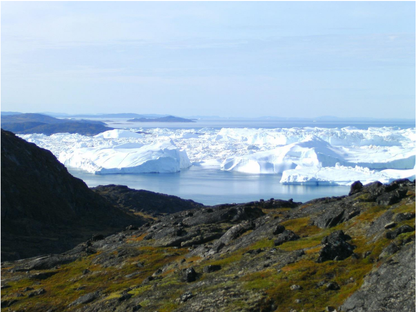
Sermermiut, Ilulissat (Ilinniartut pinngortitalerinerminni assilisaq)

Sulinermi misiliiffigisat, ilinniarfik kiisalu ilinniartullu akornanni suleqatigiinneq ataqtigiisaarisumit kiisalu ilinniartitsisumit ataqtigiissinniarneqassaaq.